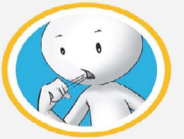
रुचा र खोकी

नोवेल कोरोना भाइरस प्रभावित देशहरूबाट आउने मानिसहरूमा दुई हप्ताभित्र ह्वाखोकी लागेमा, ज्वरो आएमा, घाँटी/टाउको दुखेमा, श्वासप्रश्वासमा अत्याधिक समस्या भएमा तुरन्त नजिकको स्वास्थ्य संस्थामा सम्पर्क गर्ने ।