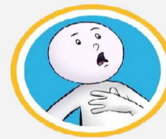
श्वास प्रश्वासमा अत्याधिक समस्या