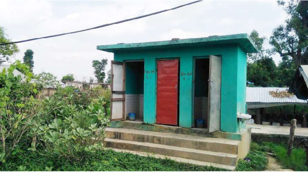
गोदावरी-५, गेटीका मुक्त कर्मैयाले प्रयोग गर्दै आइरहेको शौचालय ।

उनले विद्युत नहुँदा राती अन्धकारमा बस्नु परेको गुनासो गरिन । अहिले सञ्चारले पनि व्यापकता पाइसकेको छ । उनको हातमा पनि सञ्चारका नाममा मोबाइल थियो । उनले मोबाइल देखाउँदै भनिन- यहाँ विद्युत नहुँदा दैनिक पसलमा १६ रुपैयाँ तिरेर चार्ज गराउँछौं । उनले